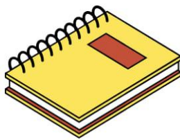
C'est un cahier