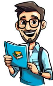
C'est un professeur