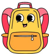
C'est un cartable