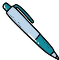
C'est un stylo