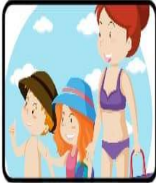
Aller à la plage