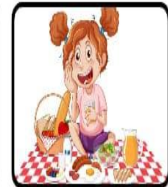
Faire un pique-nique