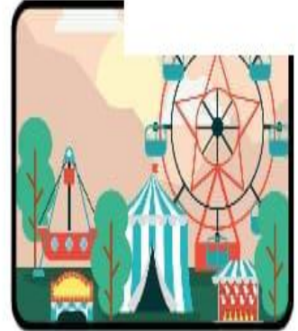
Aller à un parc d'attractions