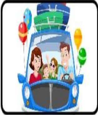
Partir en vacances