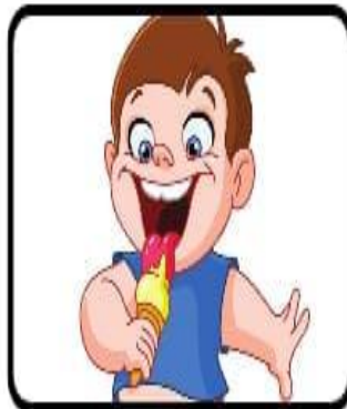
Manger une glace