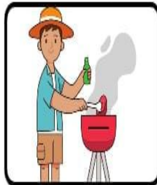
Faire un barbecue