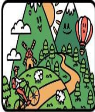
Aller à la montagne