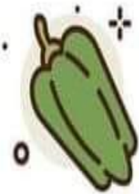
UN POIVRON VERT