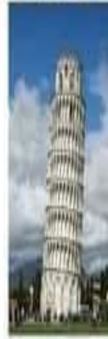
la tour de pise