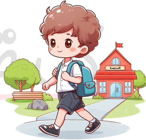
الذَّهَابُ إِلَى الْمَدْرَسَةِ