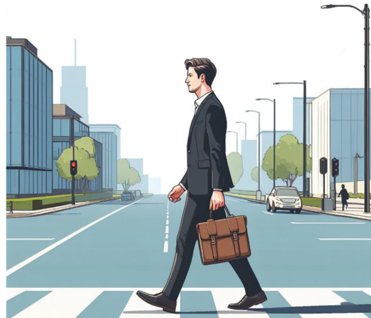
الذَّهَابُ إِلَى الْعَمَلِ