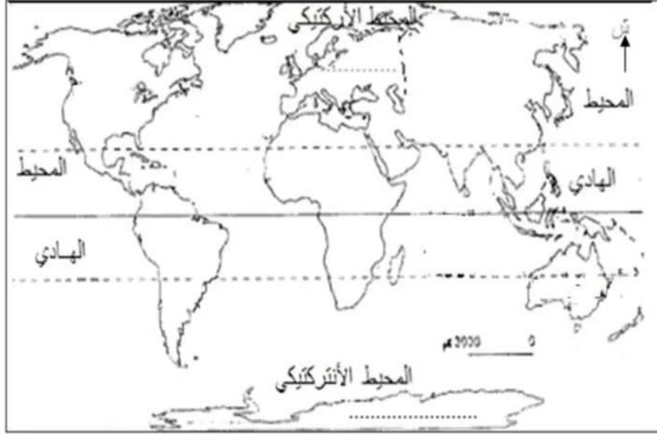
خريطة القارات والمحيطات

(8) أصنّف القارات إلى قارات جنوب خط الإستواء وقارات شمال خط الإستواء