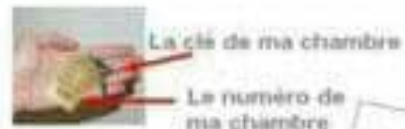
La clé de ma chambre