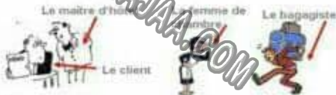
Le maître d'hôtel