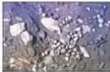
رعاية تتس إلى الحضارة القبصية