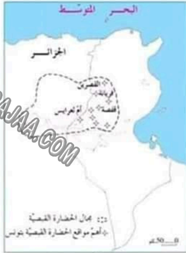
مجال الحضارة القبصية وأهم موانعها بالبلاد التونسية