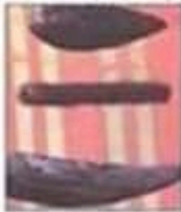
سكان من العصور تتس إلى الحضارة القبصية