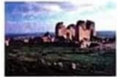
موقع فوروم طيبكا

* الفوروم : وهي ساحة بقلب المدينة يجتمع فيها السكان في المناسبات الهامة السياسية والدينية.