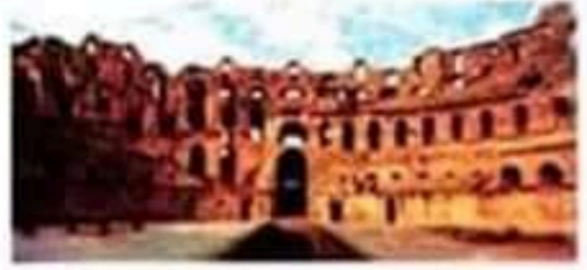
الملاعب الدائري بمدينة تيسدروس (الجم)

* المعابد: كمعبد الكابتول بسفيطلا (سبيطلة حاليا).