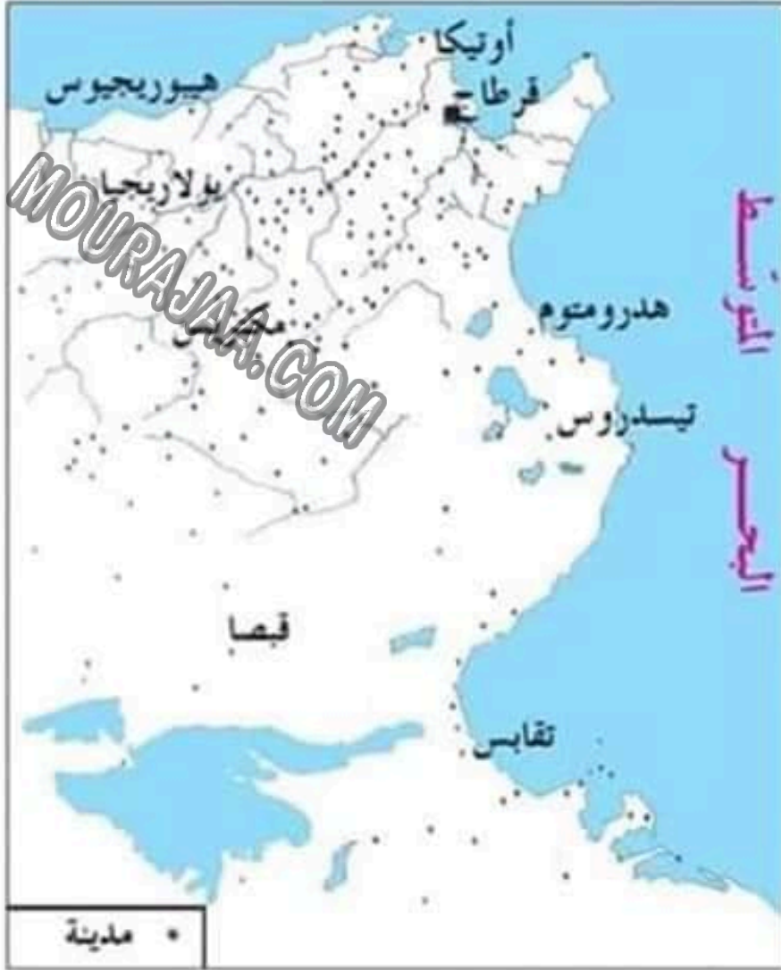
خريطة المدن بأفريقيا الرومانية في العهد الروماني