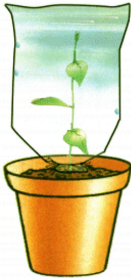
النبتة دون أوراق أصيص ب

إذا أخذنا نبتتين، وقمنا بتغليف كل واحد منهما بكيس من البلاستيك، النبتة الأولى مورقة ومغروسة في الأصيص (أ)، والثانية مجردة من أغلب أوراقها ومغروسة في الأصيص (ب)؛ نلاحظ بعد فترة زمنية أن الكيس في الأصيص (أ) يحتوي على عدد كبير من قطرات الماء على سطحه الداخلي يفوق ما هو موجود في الكيس الثاني (انظر الصورة). فنستنتج أن النبتة بعد أن امتصت الماء بواسطة جذورها، تطرح جزء منه - على شكل بخار الماء - نتيجة عملية التبخر، والتي تتم على مستوى الأوراق.