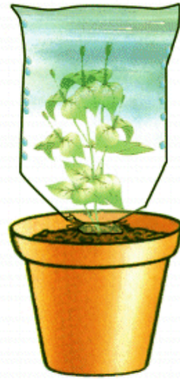
النبتة بأوراقها أصيص أ