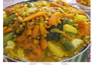
كسكسي باللحم او بالسّمك