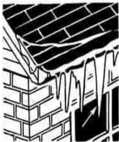
les glaçons (un glaçon)