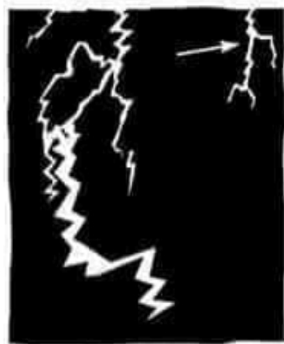
les éclairs (un éclair)