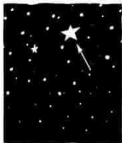
les étoiles (une étoile)