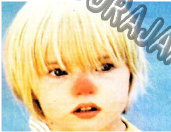
نقص ملحوظ في حاسة الشم