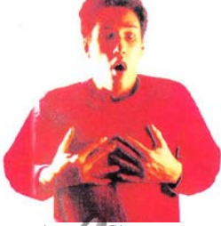
اضطرابات في الجهاز التنفسي