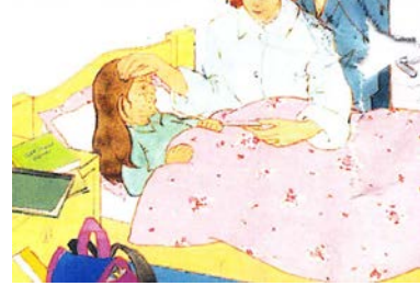
ارتفاع في درجة الحرارة