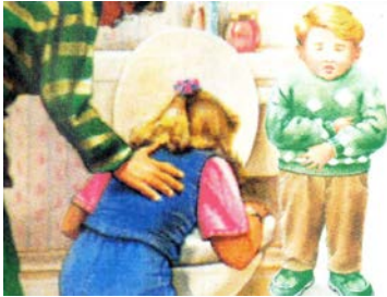
اضطرابات هضمية ومعوية وتقيؤ وإسهال