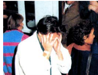
الشعور بالصداع وآلام في الظهر