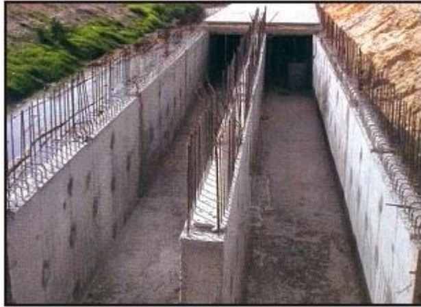
قناة لتصريف مياه الأمطار

هناك العديد من الأطراف المتدخلة في عملية التهيئة والتطهير وهي المؤسسات الخاصة بميادين التهيئة السكانية والسياحية والصناعية مثل الوكالة العقارية للسكنى والديوان الوطني للتطهير حيث تقوم هذه الجهات بتقسيم الأراضي وإنجاز شبكة مياه الأمطار وشبكة المياه المستعملة وربطها بالشبكة العمومية للتطهير وإنجاز شبكة التنوير والكهرباء والماء وإنشاء الطرقات والأرصقة.