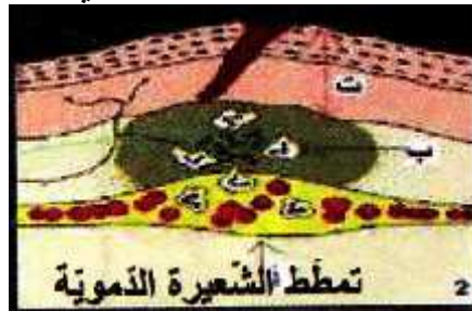
تعرض الجلد إلى وخز شوكة

قد يتعرض الجلد إلى جرح أو حرق أو وخز إبرة فتجد الجراثيم الضارة منفذا للدخول إلى الجسم فتجد داخله ظروفا ملائمة (دواء، غذاء) فتتكاثر وتفرز مواد سامة ينجر عنها تعفن جرثومي. وهذا هو الالتهاب الموضعي والذي من أعراضه، احمرار المنطقة المصابة وارتفاع درجة حرارتها وذلك نتيجة تمطط الشعيرات الدموية المتواجدة في المنطقة المتضررة. وألم ناتج عن تهيج النهايات العصبية الموجودة بالجلد من جراء السمين الذي تفرزه الجراثيم.