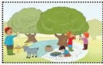
موسم جني الزيتون