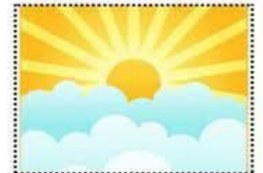
شروق وغروب الشمس