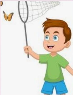
مطاردة فراشة/ عصفير...