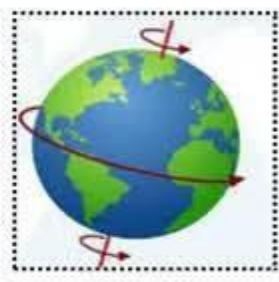
دوران الأرض حول الشمس