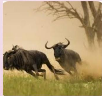
للهروب من العدو