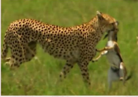
للبحث عن الغذاء

تتنقل الحيوانات من مكان إلى آخر لعدة أسباب: