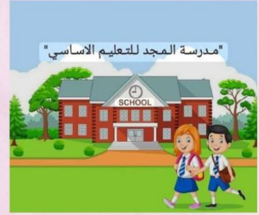
للذهاب الى المدرسة