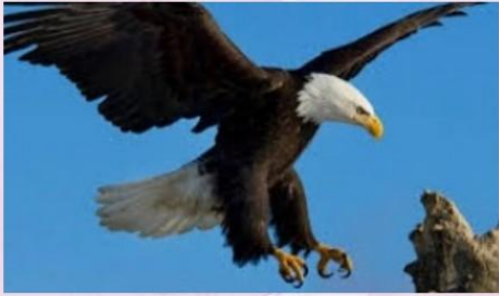
للبحث عن الغذاء