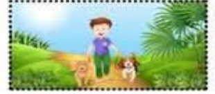
الخروج في نزهة